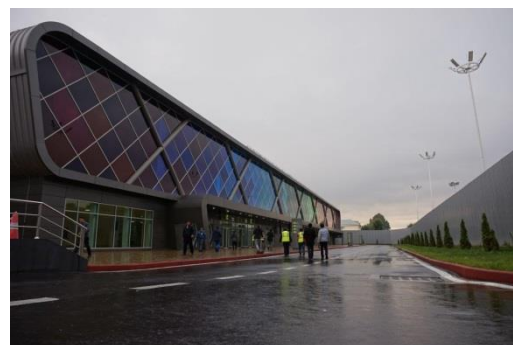
(Международный аэропорт Душанбе)